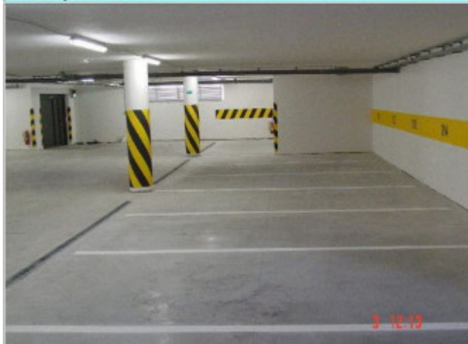
garáže - pohľad z