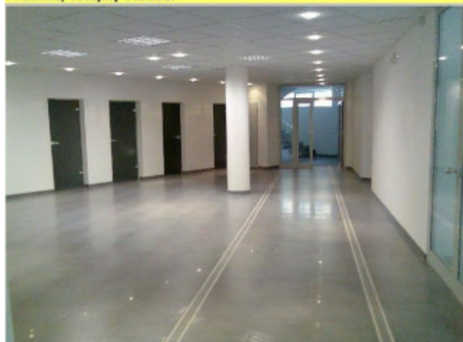
prizemie, vstupny vestibul