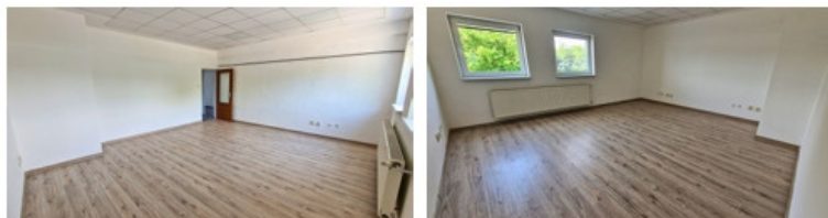
kancelária 201 - 66,4m 2