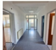
kúpeľne a wc